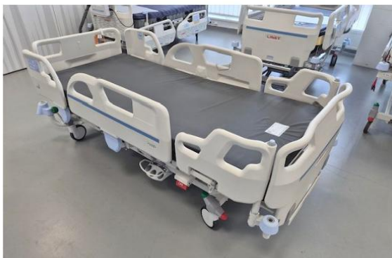
Obrázok č. 8: Prídavný pár bočníc v aktívnej polohe, t. j. používa sa (tovar z ponuky navrhovateľa).

Tento dokument má iba informatívny charakter. Nie je použiteľný pre právne účely. Dokument je vytlačeneý z portálu Úradu pre verejné obstarávanie