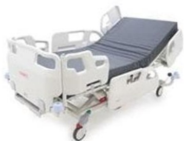
Obrázok č. 5 (tovar navrhovateľa)