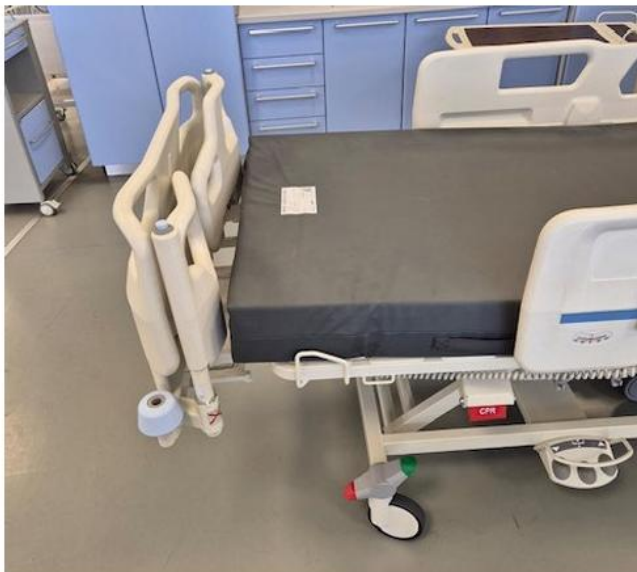
Obrázok č. 9: Prídavný pár bočníc v neaktívnej polohe (nepoužíva sa), uložený pozdĺž čela lôžka, bez nutnosti odoberania z lôžka (tovar z ponuky navrhovateľa)