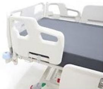
Obrázok č. 6 (tovar navrhovateľa)