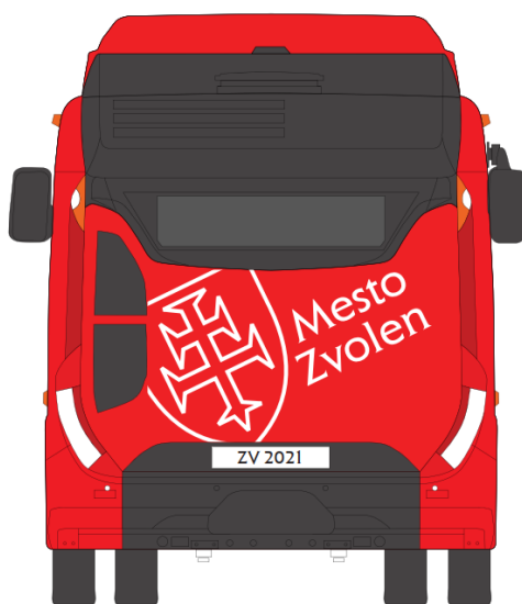
Obr. Ilustračné obrázky